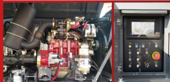
Motor Cummins QSF 2.8