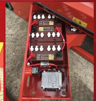
Gabinete de baterías